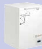
《 超低温フリーザー 》