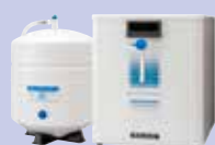
《 純水生成装置 》