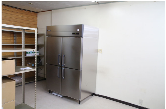
タテ型業務用冷凍冷蔵庫 GRD-122PM 幅 1200 mmタイプを寄贈・設置しました。