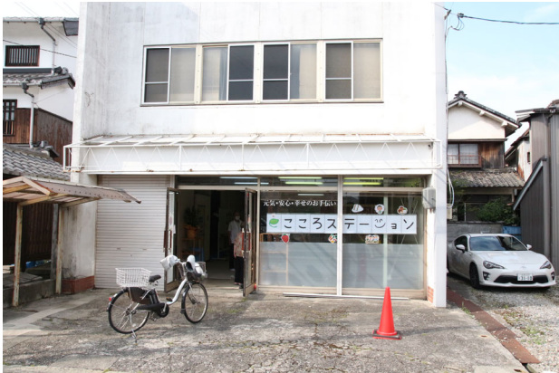
「子ども食堂ネットワークこうか」の拠点「e (え) ころステーション」。