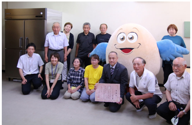
甲賀市役所職員を含めた記念写真。