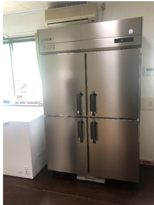
こども食堂ぎふネットワークの拠点 (岐阜県羽島市内)