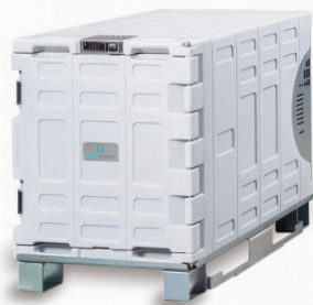
▲ F0140/FDN Auto 冷凍冷蔵タイプ