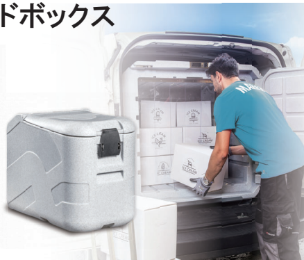
▲ T0022/FDH 恒温庫タイプ