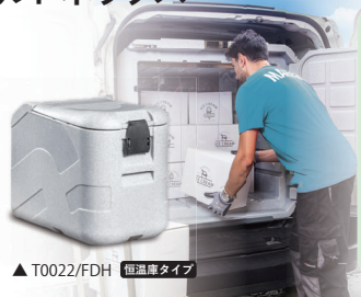
▲ T0022/FDH 恒温度タイプ