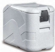
▲ T0022/FDH 恒温度タイプ