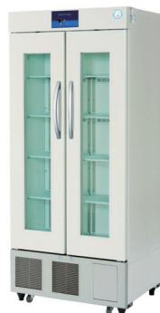
【近日発売】ノンフロンタイプ 薬用保冷庫