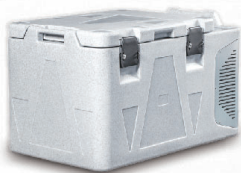
▲ T0082/FDH Auo