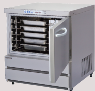
▲ブラストチラー/ショックフリーザー100V