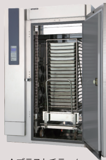
▲ブラストチラー/ショックフリーザー80型 NEW