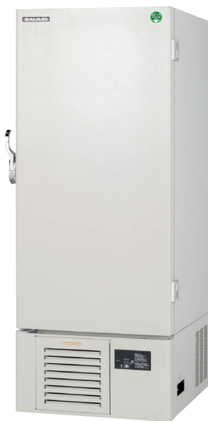
ECO PARTNER FMD-D520ETH