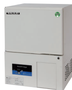
ECO PARTNER FMS-055GMX