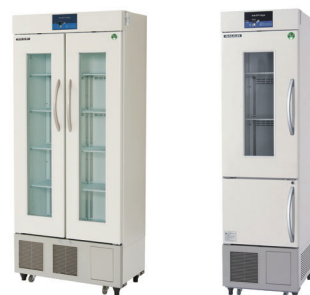
ECO PARTNER FMS-305GUX