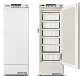
ECO PARTNER FMF-307FAX